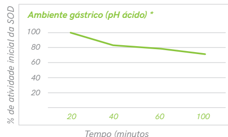
Figura 2: *Dados obtidos com a simulação in-vitro das condições gástricas e presença de pepsina por 120 minutos/2 horas.

No ambiente gástrico a atividade da SOD é mantida em praticamente 100%, sendo liberada apenas no intestino onde é desencadeada a importante atividade antioxidante. (Figura 2 e 3)