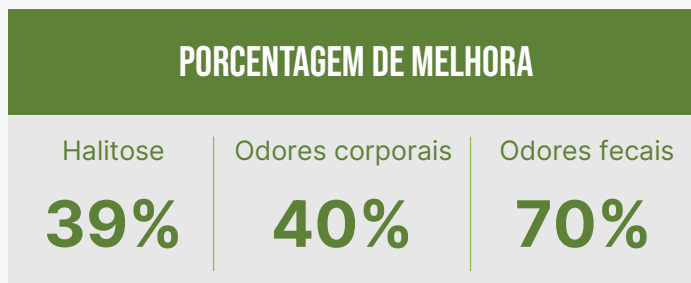
Figura 2. Percentual de melhora dos odores corporais induzidos pela administração de CHAMPORUS®(adaptado de Nishihira et al., 2017).

CHAMPORUS® demonstrou que a modulação desses metabólitos está associada à melhora significativa na percepção de odores após 4 semanas de uso (figura 2), além de reduzir os níveis de amônia no sangue (Nishihira et al, 2017).