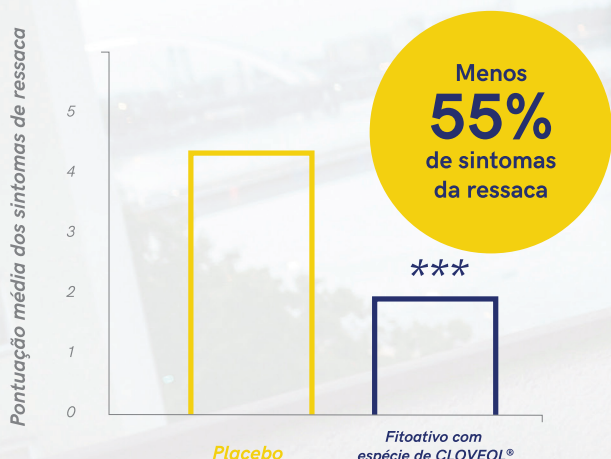
Figura 2: Médias da somatória das notas dos 15 sintomas de ressaca atribuídas pelos participantes dos grupos tratados com o placebo e com o fitoativo com a espécie de CLOVEOL® (***) p < 0,001 g paired t-test).

O acetaldeído é a toxina mais importante, formada no organismo a partir do metabolismo do etanol contido nas bebidas alcoólicas, sendo o responsável por grande parte da toxicidade sobre o fígado e também pelos efeitos indesejáveis da "ressaca". Dentre eles, os principais são dor de cabeça, mal-estar generalizado, diarreia, anorexia, fadiga e náuseas (GUO, REN, 2010). A ingestão de CLOVEOL® em dose única por via oral, antes do consumo de bebidas alcoólicas, reduziu 55% dos sintomas da ressaca.