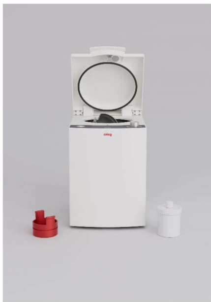
Figura 04: Foto da Planetary Mixing PM-140.