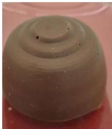
Figura 03: Aparência final da formulação de Chocolate com Clonapure® .