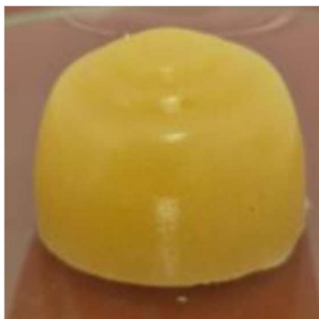
Figura 01: Aparência final da formulação das gomas com Clonapure®

Características organolépticas: consistência gomosa com leve textura arenosa aceitável inerente às características e concentração do ingrediente ativo incorporado, coloração amarelada, sabor palatável e odor característico.