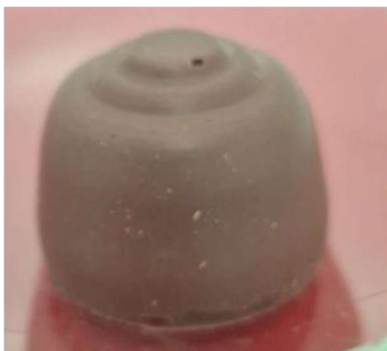
Figura 02: Aparência final da formulação de Chocolate com Clonapure® .