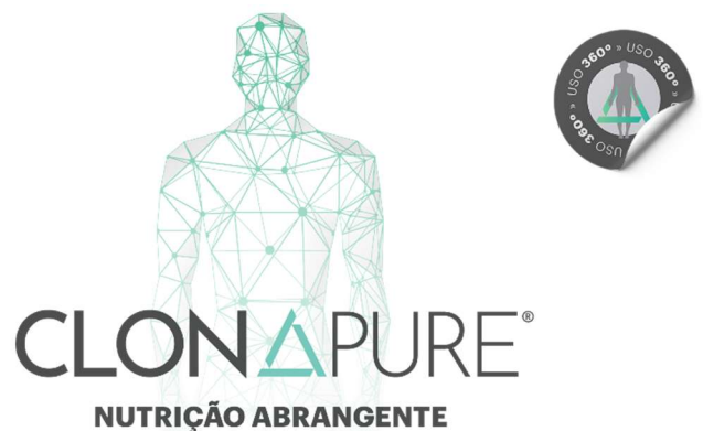
Figura 2: Efeitos de Clonapure® no aumento da síntese de ATP (trifosfato de adenosina) para energizar as células e promover benefícios neurocognitivos, como aprimoramento da memória e foco, no sistema cardíaco melhorando a saúde do coração e no sistema cardiometabólico, otimizar o funcionamento do coração e regular o metabolismo da glicose.