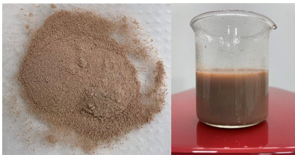
Figura 06: Sachê shake com GREENSELECT PHYTOSOME®.

c) Sugestões: a formulação pode ser reconstituída com leite (de vaca ou vegetal) ou água.