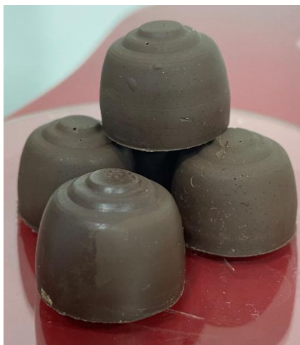
Figura 03: Bombom com GREENSELECT PHYTOSOME®.