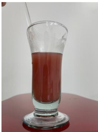
Figura 02: Suspensão GREENSELECT PHYTOSOME®.