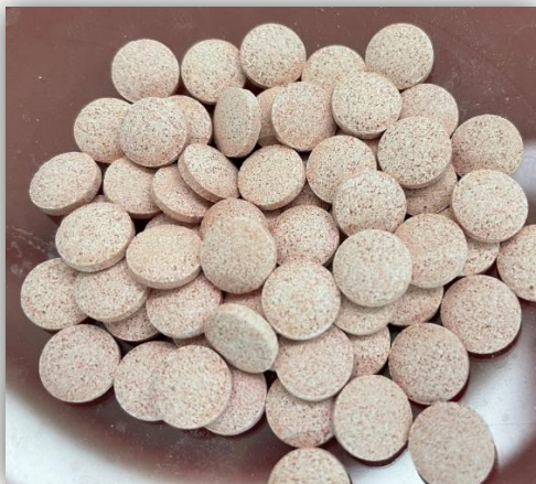
Figura 01: Comprimidos GREENSELECT PHYTOSOME®.