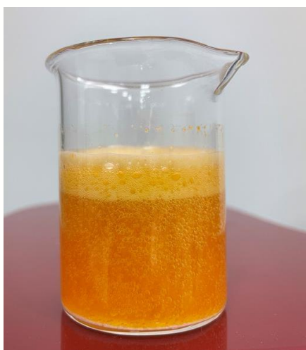
Figura 04: Sachê efervescente (dissolvido) com GREENSELECT PHYTOSOME® .

b) Armazenamento: o produto deve ser armazenado em temperatura ambiente e sachê laminado.